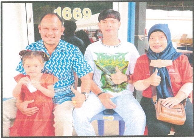
บุตรพนักงานรอคุณแม่หลังเลิกเรียน

ผู้บริหารและพนักงานนำบุตรมาร่วมกิจกรรมวันเด็กแห่งชาติ