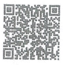
ดาวน์โหลดเอกสาร