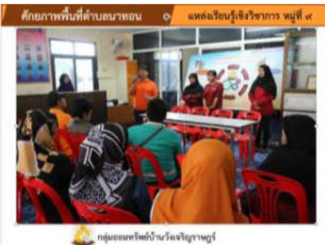
กลุ่มออมทรัพย์บ้านวังเจริญราษฎร์