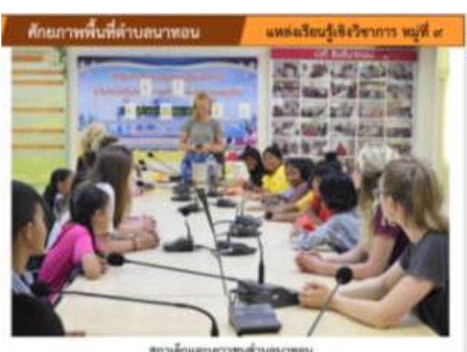
สถานเด็กและเยาวชนตำบลนาทอน